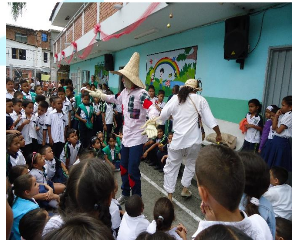
RECLICLATON- I.E. María Antonia Penagos, Palmira