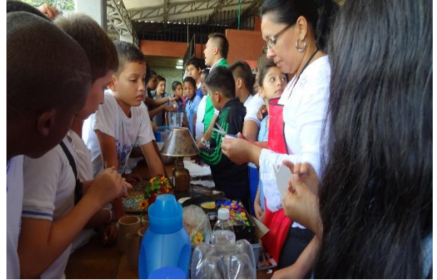
Taller reciclaje papel y artes- IE España, Jamundí

Entre las actividades desarrolladas en el proceso formativo de las comunidades se destacan los talleres de capacitación teórica, las jornadas de reciclaje, la instalación de un Punto Ecológico fijo de tres set con 53 litros de capacidad en todas las instituciones educativas participantes en los talleres de manejo de residuos sólidos, promoviendo un compromiso ambiental que disminuya el impacto generado por el inadecuado manejo de los residuos sólidos, a través de la promoción de iniciativas de separación y clasificación de los residuos sólidos en la fuente.