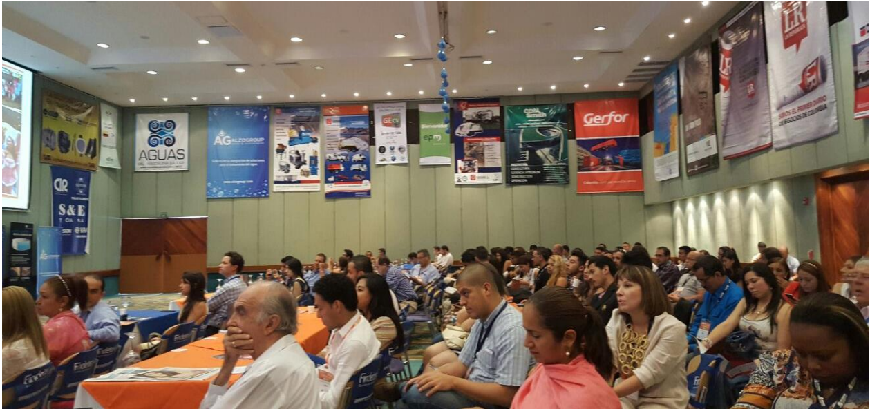
Clausura congreso ACODAL 2015

Gobierno Nacional anuncio apoyo a iniciativas de ajuste de las políticas públicas de Agua Potable y Saneamiento, propuestas por Lideres y Gestores del PAP-PDA.