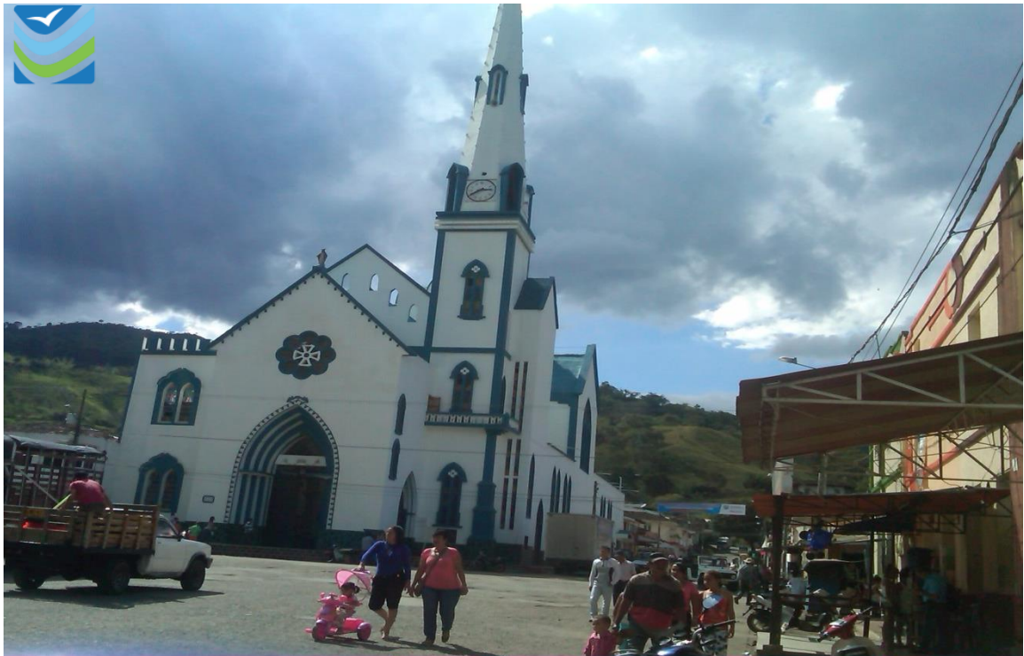
Trujillo, Valle del Cauca

Este sábado 17 de enero en el municipio de Trujillo, el Gobernador y el Gerente de Vallecaucana de Aguas entregarán las obras de rehabilitación del sistema de Acueducto de la Vereda Cristales