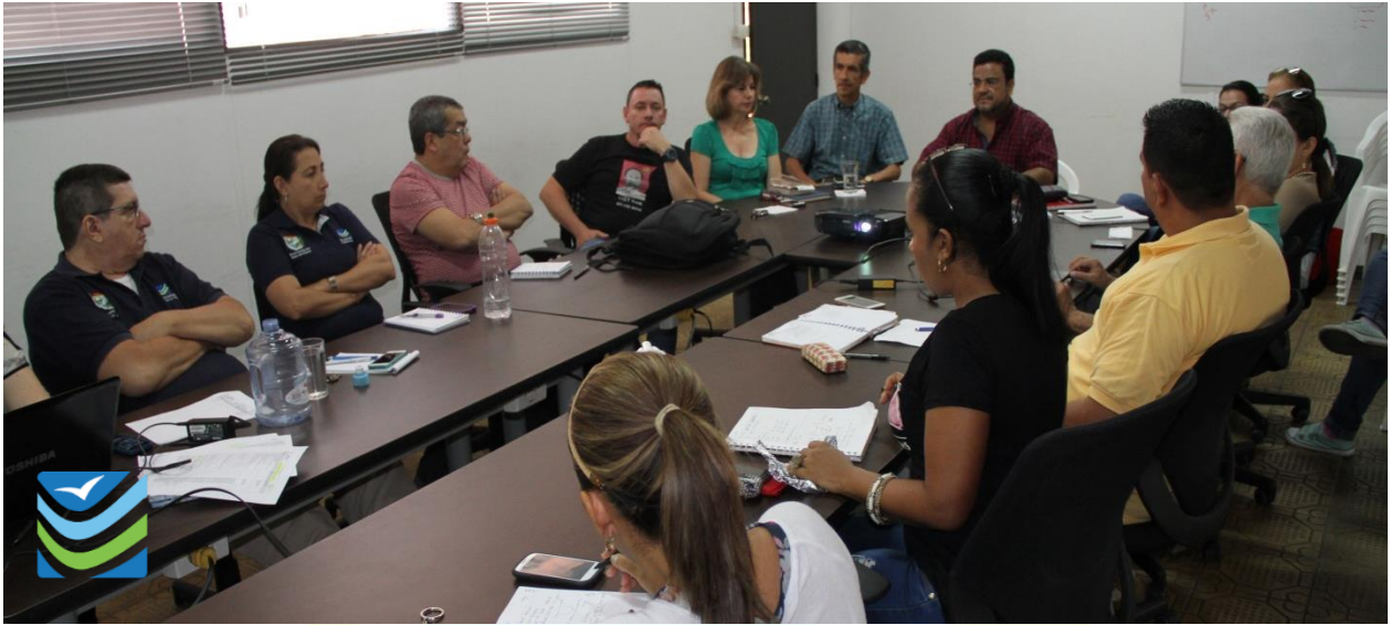
Taller de capacitación en Planificación del PAP-PDA.

Santiago de Cali, 05 de marzo de 2016. Con el propósito de capacitar y actualizar al personal técnico, administrativo, financiero y operativo de Vallecaucana de Aguas SA-ESP, sobre los mecanismos de Planeación Estratégica, El Gestor del Programa Agua para la Prosperidad – Plan Departamental de Agua del Valle del Cauca, está adelantando hoy una jornada teórico-práctica ampliada de capacitación a todo su personal, en marcada en el programa de mejoramiento continuo, implementado por la Gerencia de la entidad.