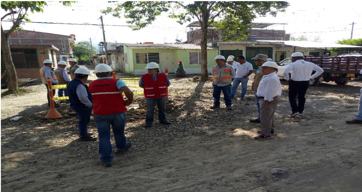
Visitas Técnicas de Inspección