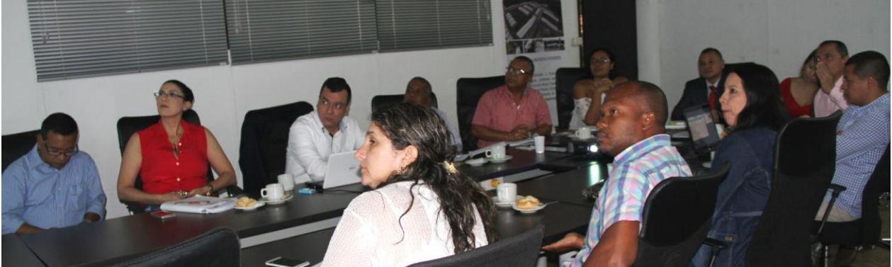
Mesas de Trabajo de Empalme